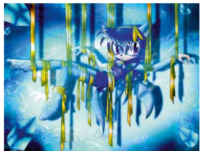
Ci-dessus : « Dark angel ». Fait sur Photoshop CS4.