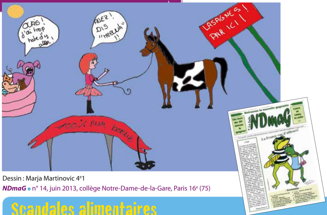
Dessin : Marja Martinovic 4 e 1

Lou Pessa Brel ● n° 21, décembre 2012, collège Jacques-Brel, Taninges (74)