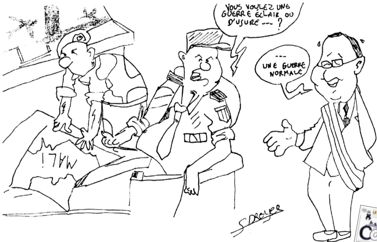
Dessin : Gaëtan Dreyer, 4 e 3 - Lou Pessa Brel • n° 22, mars 2013, collège Jacques-Brel, Taninges (74)

Les Mots Passants • n° 16, février 2013, collège Guy-de-Maupassant, Saint-Martin-de-Fontenay (14)