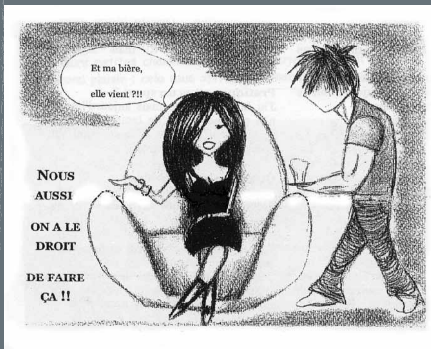
Dessin : L'Écho des Près • n° 18, février 2013, collège Les-Près, Montigny-le-Bretonneux (78)

L'Écho des Près • n° 18, février 2013, collège Les-Près, Montigny-le-Bretonneux (78)