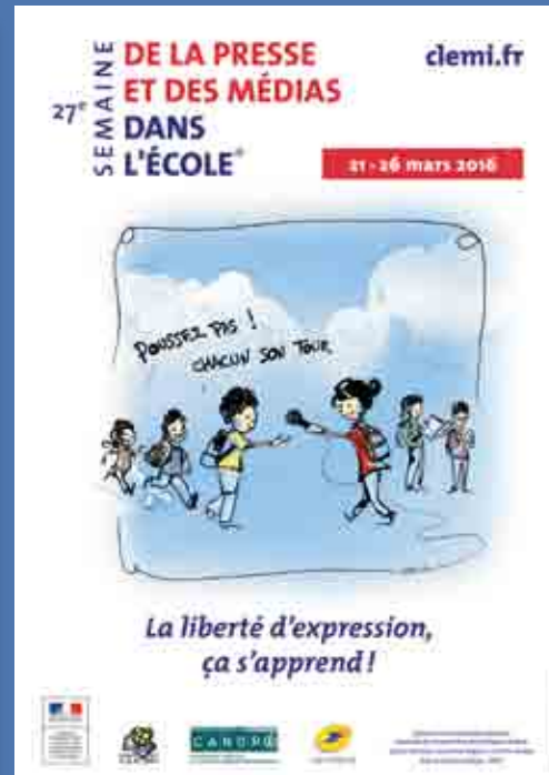
Illustration : © Ulric Leprovost Lauréat du concours de dessin de presse «Trophée Presse-Citron» organisé chaque année par l'École Estienne, à Paris.

Freedom of Expression National Monument – Foley Square, New York, 2004. Cette installation éphémère invite le public à venir s'exprimer.