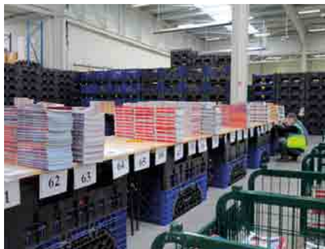
Confection des colis-presse sur la plateforme industrielle de Viapost-Industries de Chilly-Mazarin

Une équipe d'une cinquantaine de personnes, dédiée à l'opération, confectionne plus de 43 000 « colis-presse ». Le Groupe La Poste participe aux frais d'acheminement des journaux dans les 15 800 établissements inscrits en finançant intégralement leur distribution par les facteurs. Il prend également en charge l'expédition de 6 500 exemplaires de journaux scolaires.