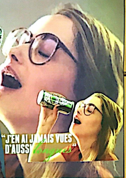
"J'EN AI JAMAIS VUES D'AUS..."