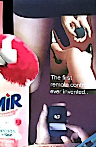
The first remote control ever invented...

"VOUS CROYEZ QUE LA TAILLE CA CHANGE LE...?" "J'UTILISE TOUJOURS LA MEME DEPUIS DES ANNES..."