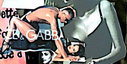
Je suis virage. Et vous?

DES FÉMINISTES CLAMENT LEUR DROIT À DISPOSER DE LEUR CORPS.