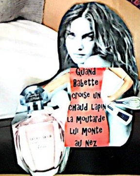
Quand Babette croise un chaud Lapin la moutarde lui monte au nez.