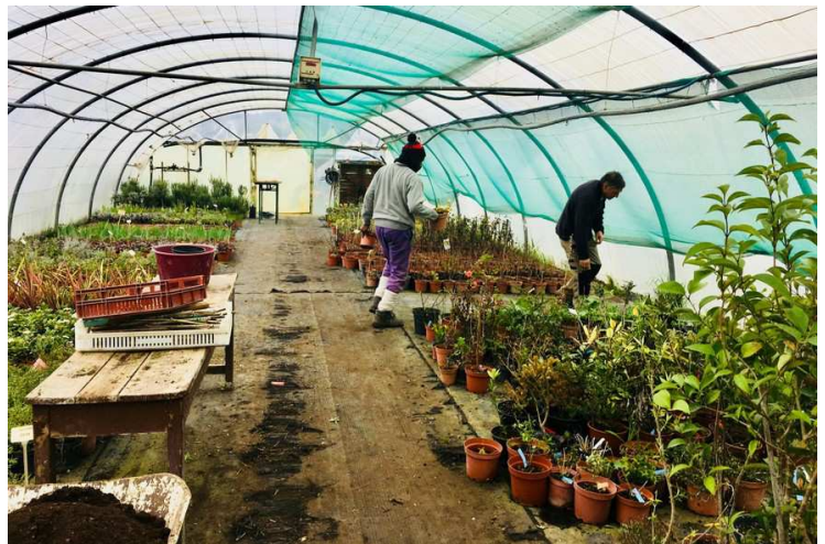
Le potager d'une prison ouverte à Mauzac en Dordogne