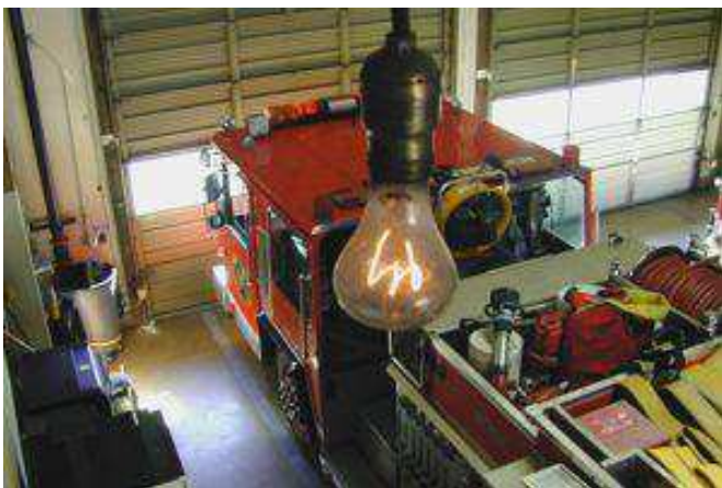
L'ampoule jamais éteinte depuis 1901

Des constructeurs mettraient dans des réfrigérateurs des pièces indispensables qui ne se fabriquent plus.