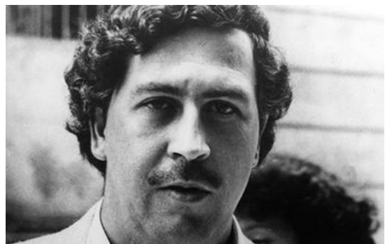
Escobar, un parrain de la drogue à deux visages p. 6