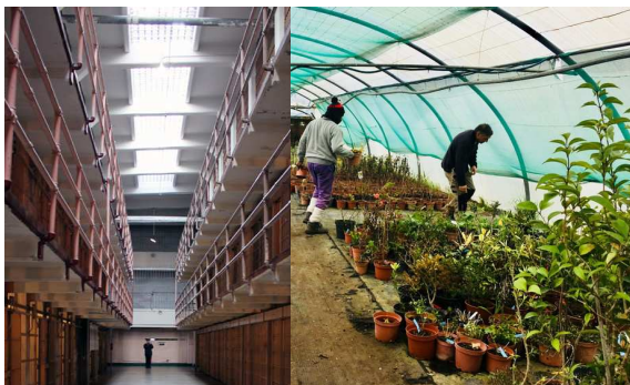
De la prison d'Alcatraz aux prisons ouvertes p. 1,2