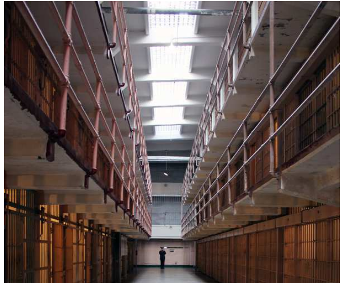
La prison d'Alcatraz