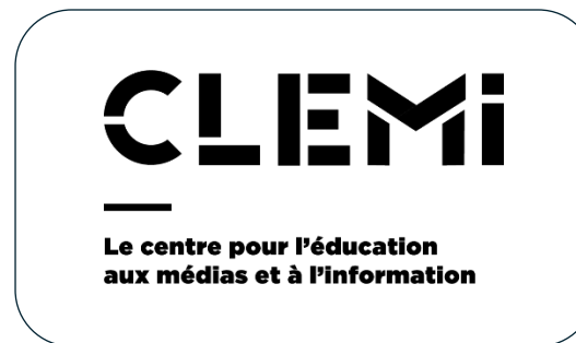
Logo version noire