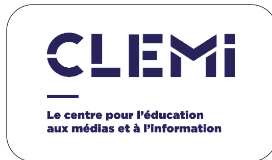
Logo version bleue