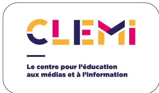
Logo de référence