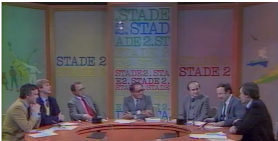
Capture d'écran de l'émission Stade 2 (Antenne 2) du 1 er février 1981.

L'enseignant organise ensuite une mise en commun pour établir qu'il s'agit de la même émission, à trente-six ans d'intervalle. Il demande ensuite aux élèves de lister les différences notées entre les deux émissions. Au fil des échanges, il émerge que la représentation des femmes dans cette émission sportive a évolué positivement. Pour conclure la séance, l'enseignant s'appuie sur des extraits du rapport de l'Arcom sur la représentation des femmes dans le paysage audiovisuel français pour expliquer comment les choses ont évolué, ces dernières années, même si la parité n'est pas encore atteinte dans certaines catégories.