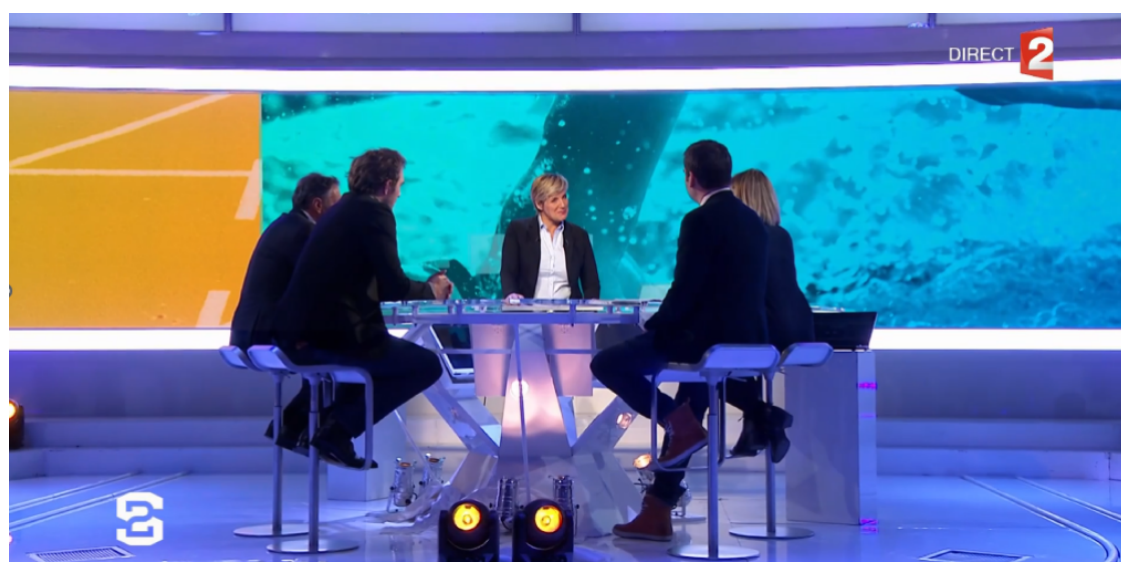
Capture d'écran de l'émission Stade 2 (France 2) du 29 janvier 2017.